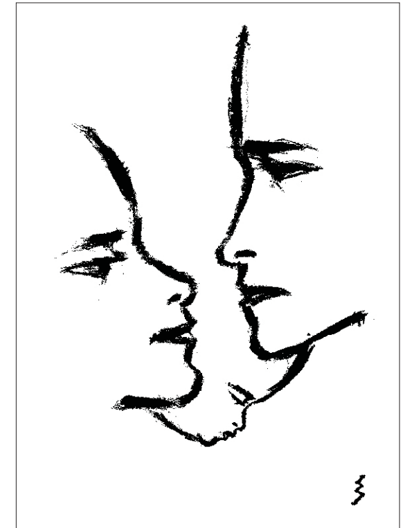
Emil Jensen "Die Familie", 1947