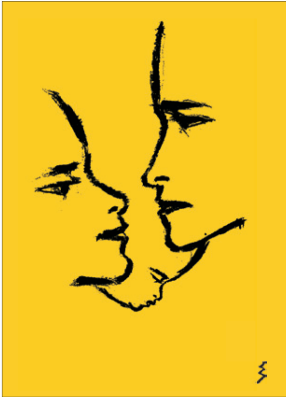
Emil Jensen "Die Familie", 1947

Geburtshilfe - sanft und sicher - 15. Kongress 23.-24. März 2012 Gastronomie im Stadtpark, Bochum