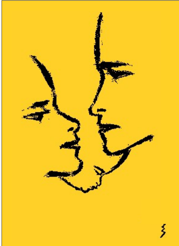
Emil Jensen "Die Familie", 1947

Geburtshilfe - sanft und sicher - 9. Kongress 24.-25. März 2006 Gastronomie im Stadtpark, Bochum