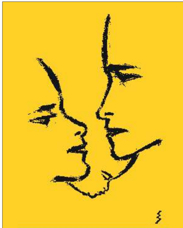
Emil Jensen "Die Familie", 1947

Geburtshilfe - sanft und sicher - 8. Kongress 18.-19. März 2005 Gastronomie im Stadtpark, Bochum