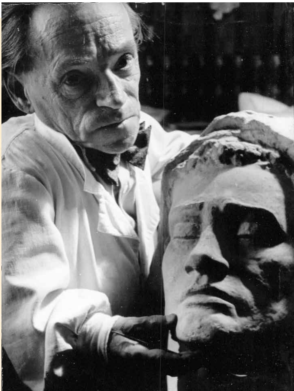
Im Atelier Starnberg mit Skulptur ‚Das große Leid‘, die den Bombenangriff auf das Ohlendorff-Palais im Juli 1943 unbeschadet überstanden hat.