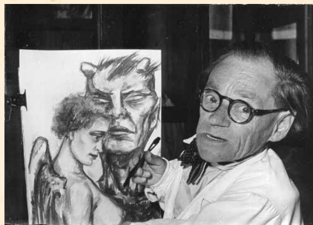
Atelier Starnberg, Prinz-Karl-Straße 46, ca. 1960.